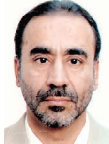
بقلم: د. إسماعيل محمد المدني

التلوث خاصة، بأنها مشكلات جامدة تخص الجهة المعنية بالبيئة فحسب، وإنما تؤكد المنظمة أن البعد الأهم لاية قضية بيئية هو الجانب المتعلق بكل أركان صحة الإنسان، الجسدي والعقلي والنفسي، ولولا هذا الجانب الصحي الواقعي لما اهتم المجتمع الدولي عامة بالبيئة وقضاياها المتشعبة والمعقدة. فكل قضية بيئية لها ارتباطات وثيقة وعلاقة مباشرة بالأمن الصحي للبشر، وفي الوقت نفسه كل قضية صحية والأسقام والعلل التي يعاني منها الإنسان حالياً، نجد أن للبيئة والتلوث بصمة كبيرة فيها، ولها دور في نزولها على الإنسان والإصابة بها. فإذا درسنا أسباب إصابة الإنسان بالسرطان، فسنتكشّف أن لملوثات البيئة اليد الطولى في ذلك، وإذا اردنا أن نتعرف على أسباب ارتفاع أعداد المصابين بأمراض القلب في سن مبكرة وبأمراض كانت تصيب قلوب الشيوخ وكبار السن الذين اشتعل رأسهم شيباً، فسنظهر شريكاً أمراض القلب، وكذلك بالنسبة إلى أمراض الجهاز التنفسي، والسكري، والبدانة وزيادة الوزن، وأمراض العين، وأمراض الحساسية، وكلها عندما نتعمق فيها نجد أن التلوث هو أحد المتهمين للإصابة بالمرض، حتى أن تلوث الهواء يقف وراء تفاقم وشدّة الأعراض المرضية التي يتعرض لها المصاب بكورونا، ما قد يعجل في وفاته، وفقاً للدراسة المنشورة في ٣١ مايو ٢٠٢٢ في مجلة أمريكية «طب الجهاز التنفسي والعناية المركزة: Respiratory and Critical Care Medicine»، تحت عنوان: «التعرض لملوثات الهواء الجوي وشدّة الإصابة بالموت من كوفيد-١٩ في منطقة جنوب ولاية كاليفورنيا». وختاماً في تدريبي فإن وزارات الصحة لن تنجح في أداء رسالتها في وقاية صحة المواطنين من الأمراض، إلا إذا أدخلت الجانب البيئي كعامل رئيس للإصابة بالأمراض في كل البرامج والسياسات الصحية الوقائية والعلاجية.