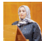
○ جليلة بنت السيد جواد وزيرة الصحة