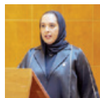
○ أمينة بنت أحمد المرجعي وزيرة الإسكان والتخطيط العمراني