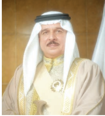
○ جلالة الملك المعظم.