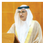
○ أسامة العصفور وزير التنمية الاجتماعية