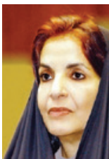
الأميرة سبيكة بنت إبراهيم

تلقت صاحبة السمو الملكي الأميرة سبيكة بنت إبراهيم آل خليفة فرقة ملك البلاد الأميرة ربيعة العنبري ألقى برقية شكر هدايا من الحكومة المغربية في ظل الدولة المغربية، معبراً عن شكرها وامتنانها لسموها.