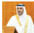
○ حمد الكعبي وزير شؤون مجلس الوزراء