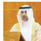
○ محمد بن يهنا وزير النفط والبيئة