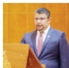
○ ياسر حبيشان وزير شؤون الكهرباء والماء

وجناهم جلالته على توفيق مناسبتهم الجديد. متمنياً لهم يوم النجاح والسداد في أداء مهامهم على الوجه الأكمل بعون الله تعالى وتوفيقه. متمنياً جلالته بيده الكفالات هذه المسؤولية الوطنية من أجل ازدهار وتقدم مستقبل البحرين. وأنّه جلالته الملك العظيم الدور المهم للشباب والعناصر الشابة لتسهم في خدمة الوطن وتقدمه مع كل الاحترام والتقدير للشعبين العاملين في تحمل هذه المسؤوليات وهم إلى اليوم محل التقدير والاعتراف. وأضاف جلالته الملك العظيم أن حكومة البحرين لها تاريخ عريق وإنجازات كبيرة على كل المستويات ومختلف المجالات. والتي هدفتها الأول خدمة المواطنين الكرام. وجنهم جلالته على مشاركة الجهود والعمل بروح الفريق الواحد لمواجهة التياا على ما تحقّق من إنجازات من أجل تعزيز مكانة البحرين وضمان تقدمها وازدهارها ورفعة من المكتسبات لصالح الوطن والمواطن.