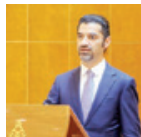
○ ولي بن ناصر العمارك وزير شؤون العلاقات والزراعة