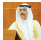
○ محمد بن ثامر العيسى وزير المواصلات والاتصالات