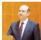
○ يوسف بن عبدالحسين خلف وزير الشؤون الاجتماعية