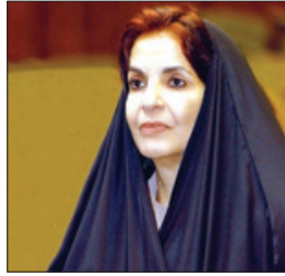
قرينة عاهل البلاد

وتقدمت الوزيرة لصاحبة السمو الملكي قرينة ملك البلاد المعظم رئيسة المجلس الأعلى للمرأة ببالغ الشكر والامتنان على ما تضمنته برفقة سموها المهينة من مشاعر صادقة وفخر وتعزز بها، والتي تأتي امتداداً لدعم سموها ورعايتها المستمرة للمرأة البحرينية حتى غدت اليوم شريكاً رئيساً في مسيرة التنمية والتقدم على كل صعيد، داعية المولى عز وجل أن يحفظ سموها ويديم عليها موفور الصحة والسعادة وطول العمر، وأن يسد على طريق الخير خطاها.